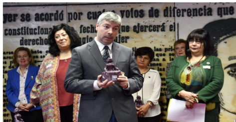
Año 2019: recibiendo el Premio "Menina" en la Sala Clara Campoamor del Senado de España.

editado, y lo llevo a gala, entidades tan diferentes como el Secretariado Internacional de la Juventud Mariana Vicenciana, y la editorial cubana "José Martí". Esa diversidad, que forma parte de mí , quiero ponerla al servicio del Ateneo de Madrid, en cuya pluralidad creo por principio.