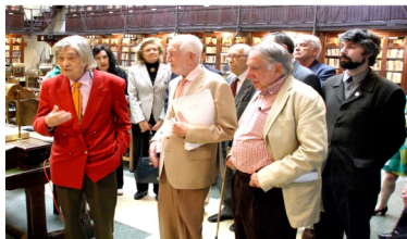
Año 2011: con el entonces Presidente (fallecido en 2014), Carlos París, y otras personalidades.

hemos pasado mal. Pero, como escribiera el gran Emile Zola, “la verdad siempre sale a flote”. Por encima de las calumnias.