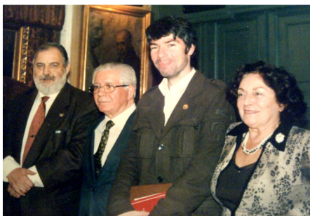
Año 2008: recibiendo el Premio “Manrique de Lara” en la Asociación de Escritores y Artistas Españoles

Señoras y señores: cuando se acerca una data significativa, como lo será para el Ateneo la del próximo 31 de mayo, tiende por naturaleza el ánimo a la reflexión, y en ese hacer, halla lo vivido su impresión más clara, su más honda huella. Lo retrospectivo, entonces, también impele; sirve para avanzar desde lo andado, sin perdersenos.